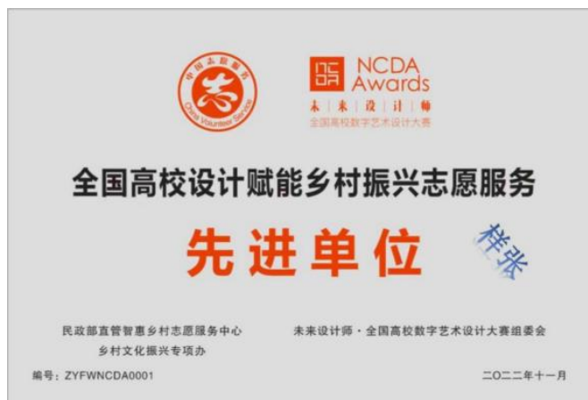
全国高校设计赋能乡村振兴先进单位牌匾